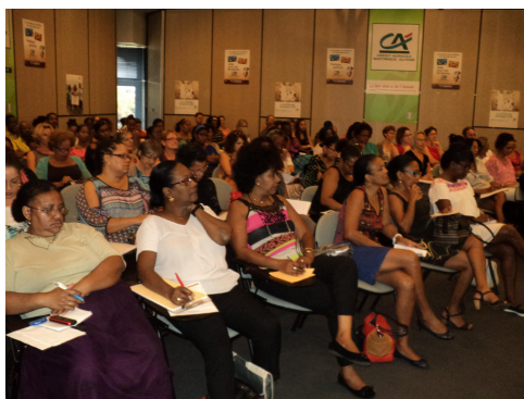
Une assistance attentive.

Membre du Conseil d'Administration de DYS MARTINIQUE.